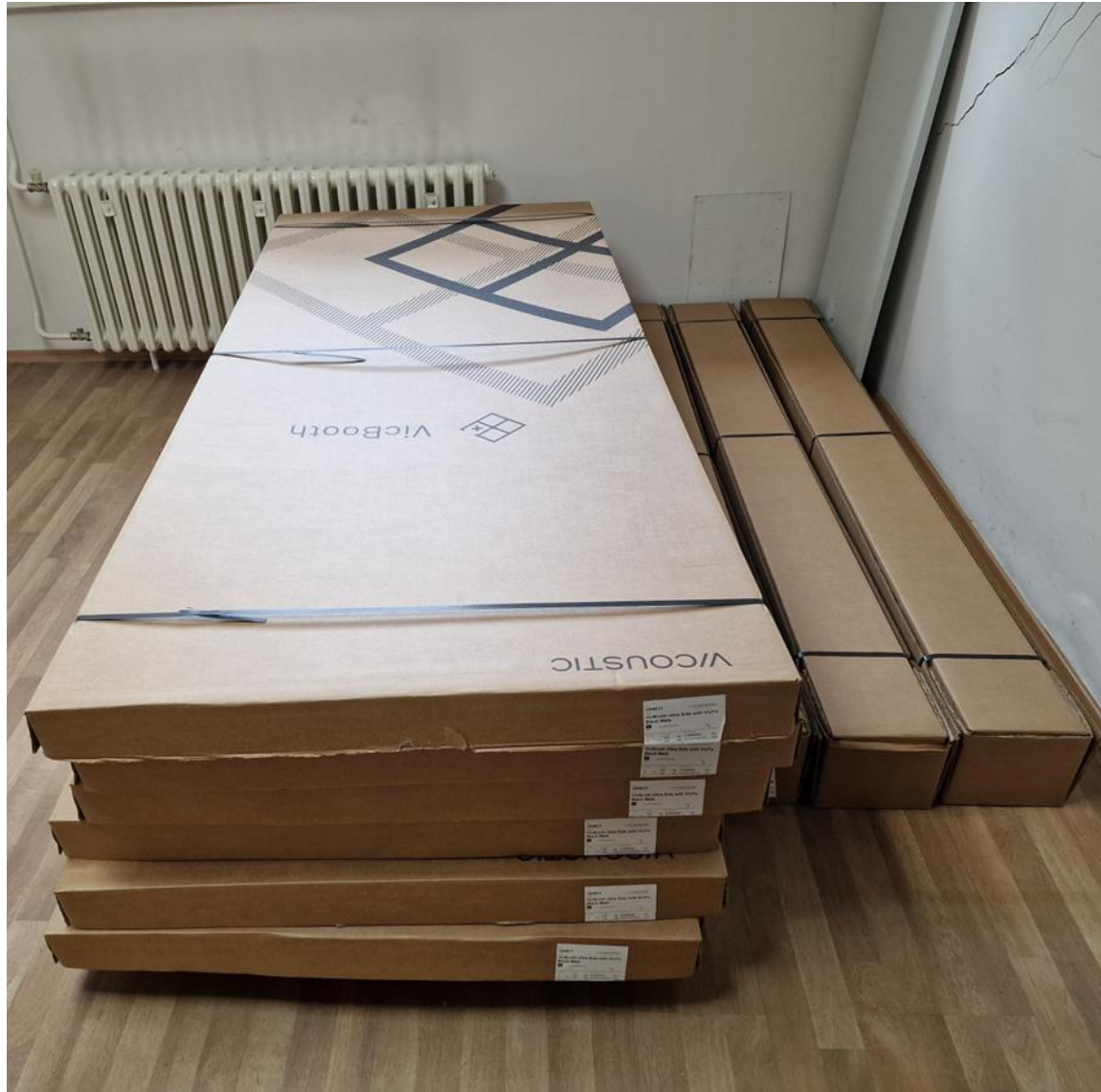
Prostor Ureda za e-učenje (podrum glavne zgrade nasuprot Arhivu)